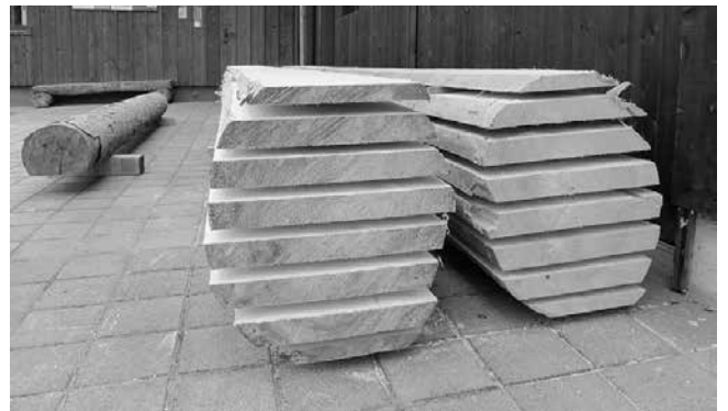
Der Schöne Tag ist zu Ende