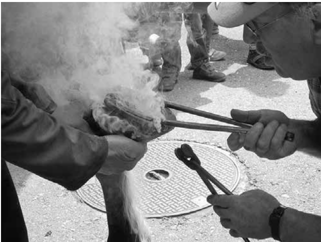
Das Warmaufrichten des Hufeisens vor der alten «Schmitte» Fehr