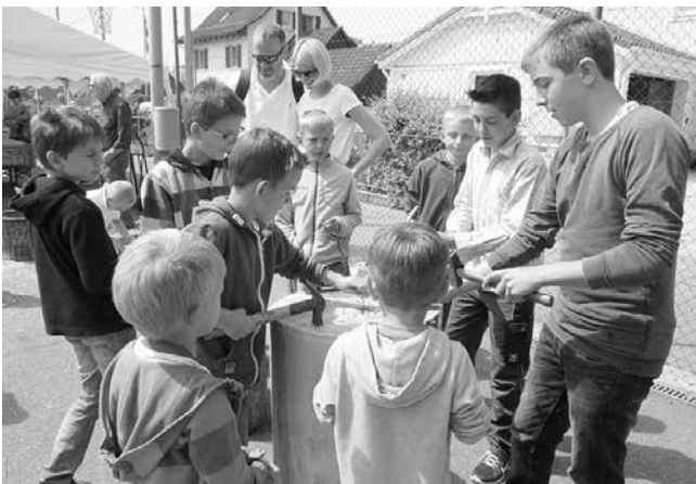
Nägel einschlagen auf dem Werkplatz