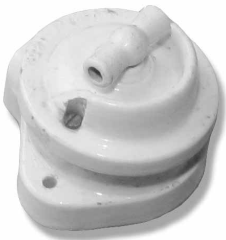
Diesen Schalter drehen wir an am 7. Mai am Schweizerischen Mühlentag

Vielleicht gibt es in einzelnen Häusern oder Estrichen Zeitzeugen, die uns an die frühe Zeit der Installation des Stromes erinnern. Auch alte Geschichten der Grosseltern aus diesem erhellten Umfeld interessieren uns. Melden Sie sich umgehend bei der Gattersagi, wir sind Ihnen dankbar.