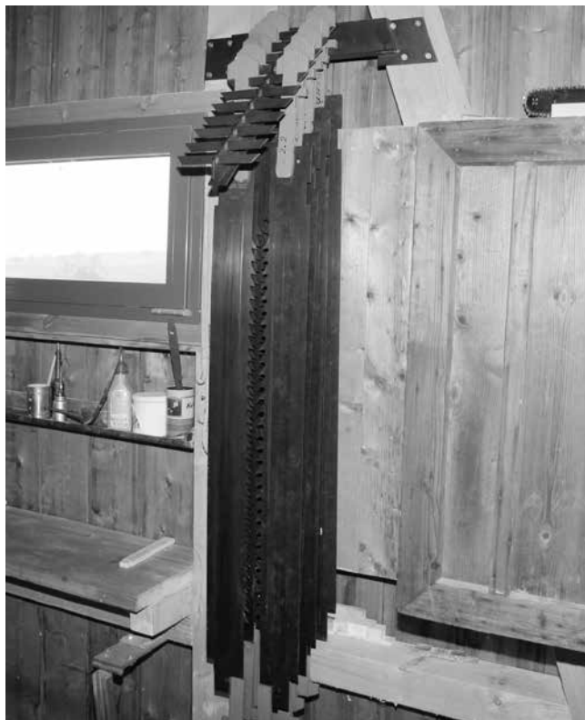
.....über das gelungene Werk (siehe Film: www.gatteragi.ch )