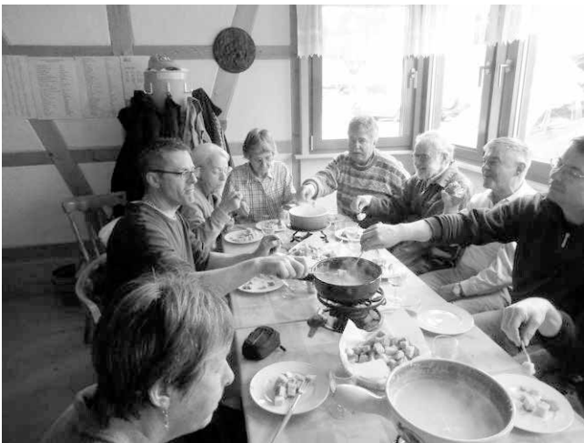
Mittags- Fondue der Helfer im Stübli am Tag des Bodeneinbaus